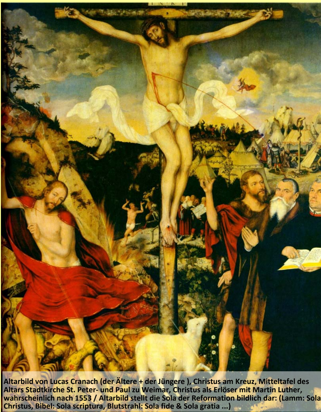
Altarbild von Lucas Cranach (der Ältere + der Jüngere), Christus am Kreuz, Mitteltafel des Altars Stadtkirche St. Peter- und Paul zu Weimar, Christus als Erlöser mit Martin Luther, wahrscheinlich nach 1553 / Altarbild stellt die Sola der Reformation bildlich dar: (Lamm: Sola Christus, Bibel: Sola scriptura, Blutstrahl: Sola fide & Sola gratia ...)